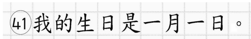
Рис.14. Образец написания иероглифических знаков

иероглифический знак и каждый знак препинания следует писать внутри отдельной клетки области ответов бланка ответов № 2 (дополнительного бланка ответов № 2) (рис. 14).